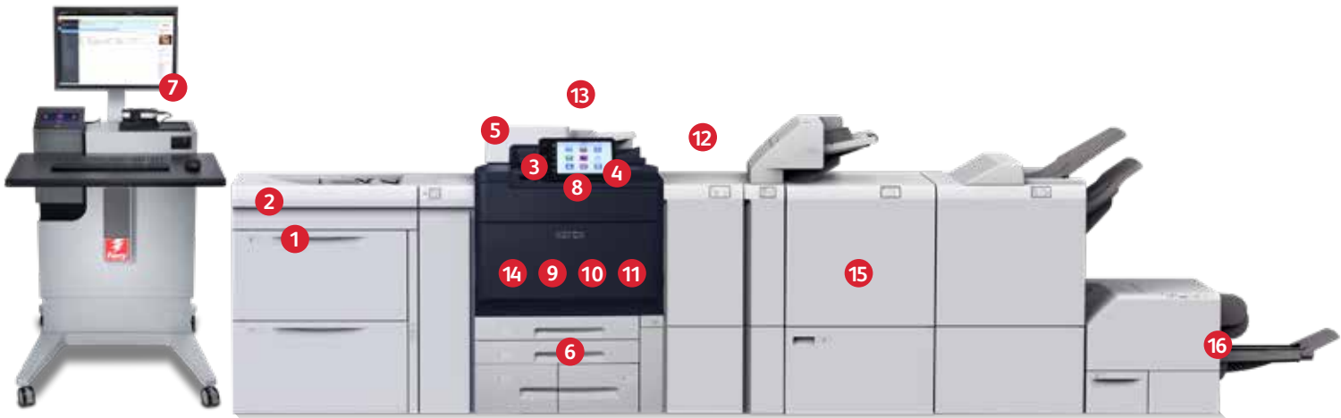
Illustration: Fiery® EX-printserver, stor fremfører med to magasiner til ark i overstørrelse, Xerox® PrimeLink® C9200 Series-printer, foldningsmodul og 2-sidet beskæringsmodul, Xerox® Production Ready-efterbehandler med pjecemodul, Xerox® SquareFold® beskæringsmodul