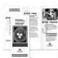
Pliage en deux, en C et en Z