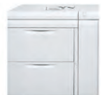
Magasin grand format et grande capacité à 2 bacs* de 2 000 feuilles chacun (4 000 feuilles au total) : jusqu'au format SRA3