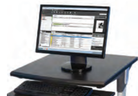
Serveur d'impression Xerox® EX, optimisé par Fiery