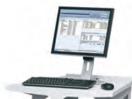
Serveur d'impression Xerox® FreeFlow