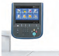
Serveur d'impression/copie intégré