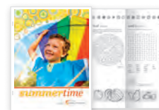
Insertions couleur, agrafage et pliage en Z format technique