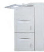
Magasin grande capacité à 2 bacs de 2 000 feuilles chacun (4 000 feuilles au total) : format A4