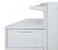
Magasin grand format et grande capacité de 2 000 feuilles : jusqu'au format SRA3