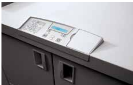
Panneau de commande pratique