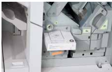
Cartouches de ruban à encoller faciles à charger

Simple à utiliser, l'encolleuse Xerox® est dotée d'un panneau de commande à partir duquel vous pouvez définir les paramètres du travail, afficher l'état du système et exécuter les tâches de base. Le changement de la bande d'encollage s'effectue également très aisément grâce à des cartouches pratiques faciles à charger.